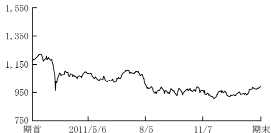
〈東証株価指数（TOPIX、配当込み）の推移〉